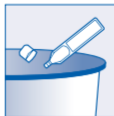
3. Ne upotrebljavajte ponovno! (Nakon upotrebe bacite)